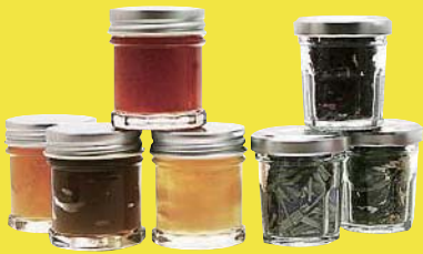
京野菜・果物ジャム、ハーブティー